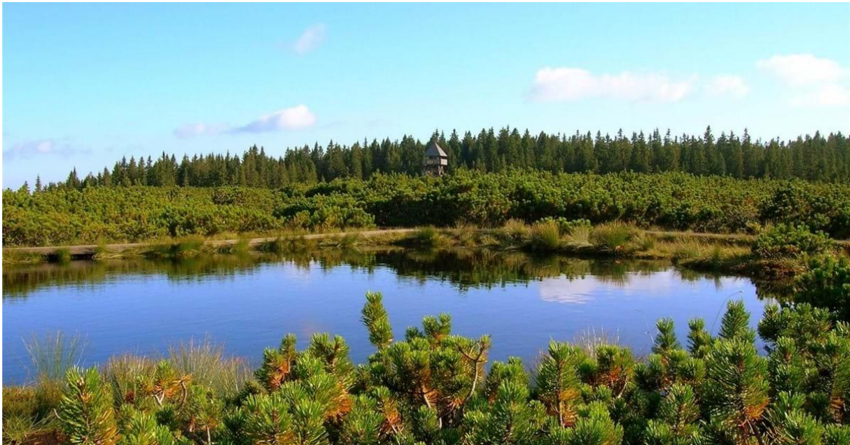
Lovrenška jezera; Vir slike: www.visitmaribor.si

Letos je poudarek na nujni obravnavi podnebnih sprememb in izgubljanju biotske raznovrstnosti, tema: »Življenjska povezanost mokrišč in ljudi«, uradna spletna stran: https://www.worldwetlandsday.org/